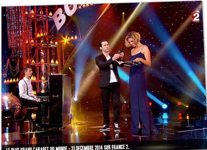
LE PLUS GRAND CABARET DU MONDE - 31 DECEMBRE 2014 SUR FRANCE 2.