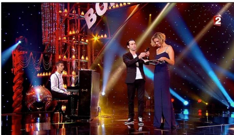
Le 31 Décembre 2014, au Plus Grand Cabaret du Monde sur France 2.