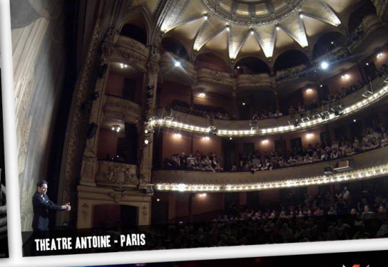
THEATRE ANTOINE - PARIS