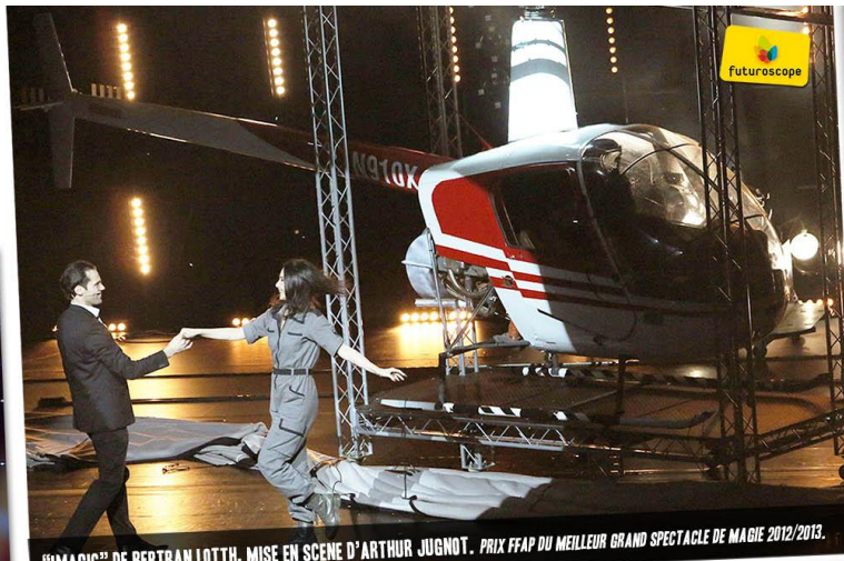
"IMAGIC" DE BERTRAN LOTH, MISE EN SCENE D'ARTHUR JUGNOT. PRIX FFAP DU MEILLEUR GRAND SPECTACLE DE MAGIE 2012/2013.