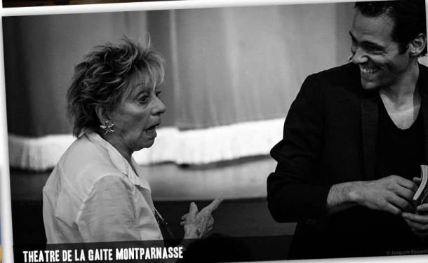
THEATRE DE LA GAITE MONTPARNASSE