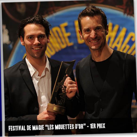
FESTIVAL DE MAGIE "LES MOUETTES D'OR" - 1ER PRIX