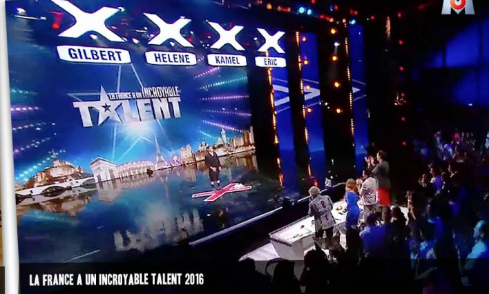
LA FRANCE A UN INCROYABLE TALENT 2016